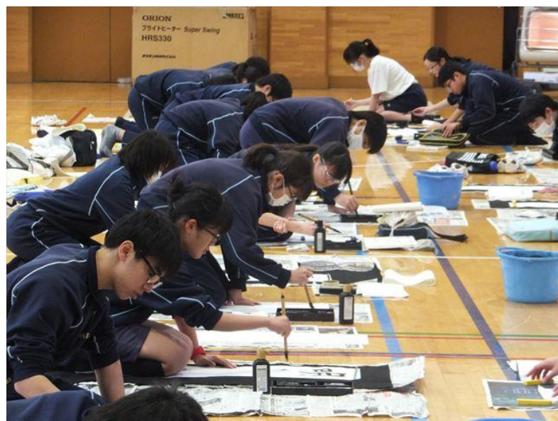
<3年生書き初めの様子>

3学期は2年生がリーダーであることを、1年生はその2年生をサポートしていくことを意識して動く学期です。1,2年生は3年生から様々なことを吸収してきました。それらを活かして、生徒会活動を活発にして、これまで以上の東名中学校をつくっていきましょう。(生徒会本部役員 2年1組)