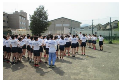
青色応援団の結団式