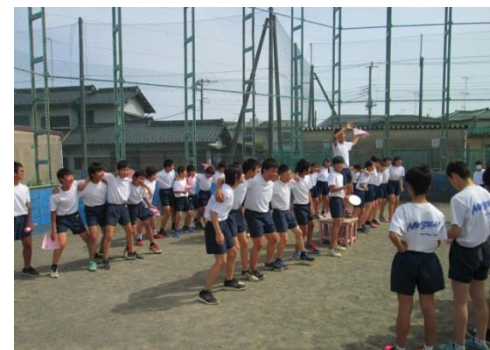
ピンク組応援団の結団式