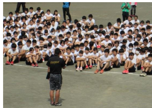
3年が引っ張るんだよ！と萬木先生の話