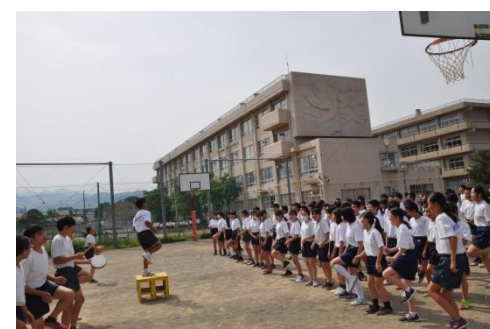
黄組応援団の結団式