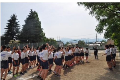
赤組応援団の結団式