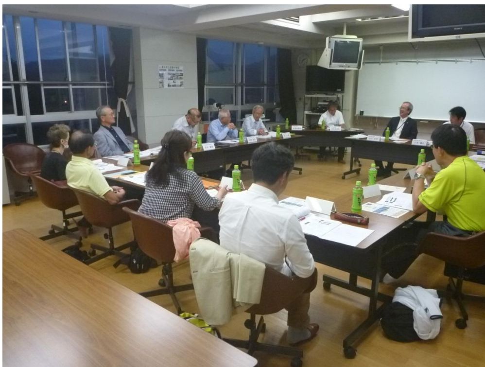
第1回学校運営協議会の様子