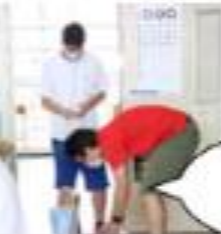
視力検査の準備中！