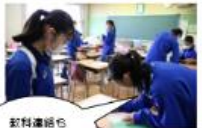
教科連絡も忘れずに！