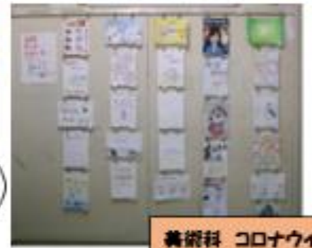
美術科 コロナウイルス感染予防ポスター