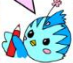
分散登校最終日と全員登校初日