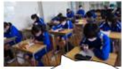
行きたい高校はどの辺だろう？