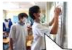
視力検査の準備中！