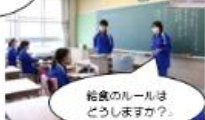
給食のルールはどうしますか？