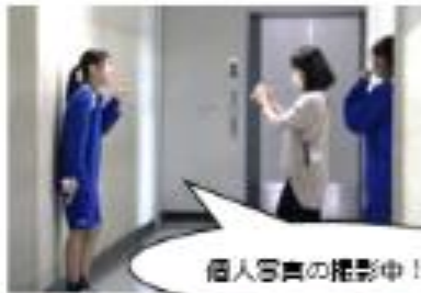
個人写真の撮影中！