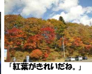
「紅葉がきれいだね。」