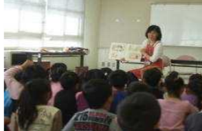
(市立中央図書館より)