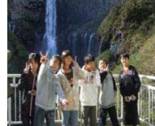
＜華嚴の滝をバックにピース＞