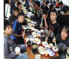
＜日光名物ゆばのお味は？＞