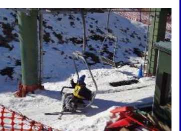
リフトに乗って上に行きます。