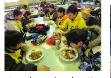
このカレーおいしい!! おかわりして午後もおぼろぞ。