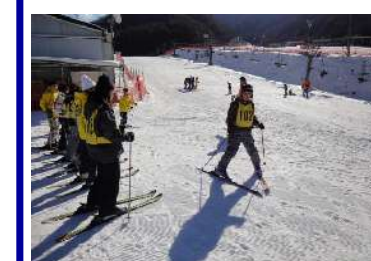
だいぶ、うまく滑れるようになったぞ。