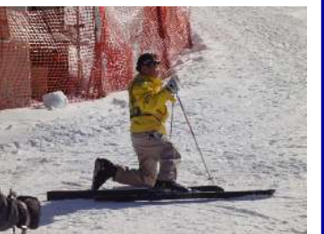
転ぶ時は、がけ側に転ぶのが基本です。さあ、練習してみよう。