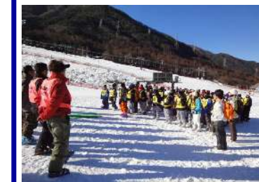
みなさん、頑張りましょう。インストラクターさんとごあいさつ。

1月14日6年生は、小学校最後の校外学習である「スキー教室」に行きました。冬場の寒さに負けずスポーツを楽しむことの大切さを味わいました。子どもたちは、実に覚えが早く、ほとんどの子が帰るころには、滑れるようになっていました。