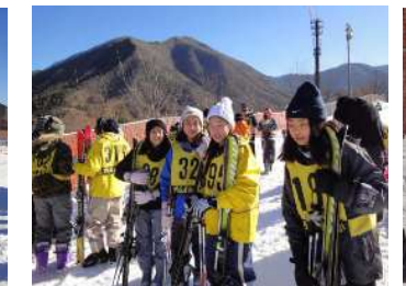
グループに分かれてレッスン開始です。