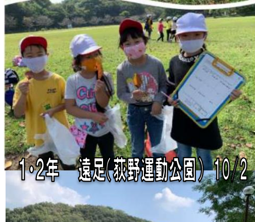
1・2年 遠足(荻野運動公園) 10/2