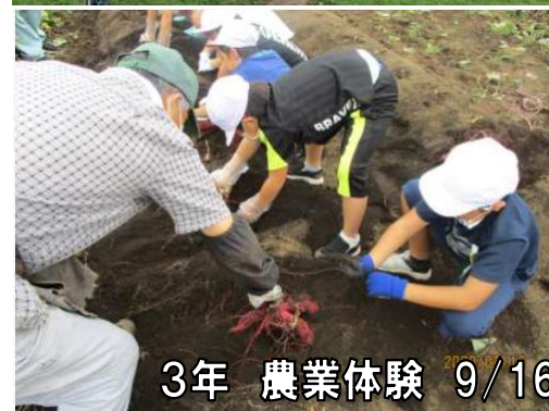
3年 農業体験 9/16