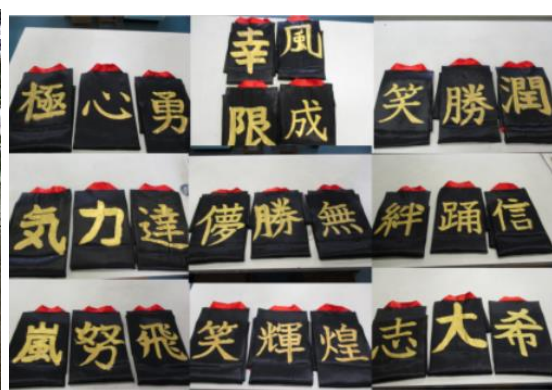
6年 漢字一文字に思いを乗せて 10/14・15