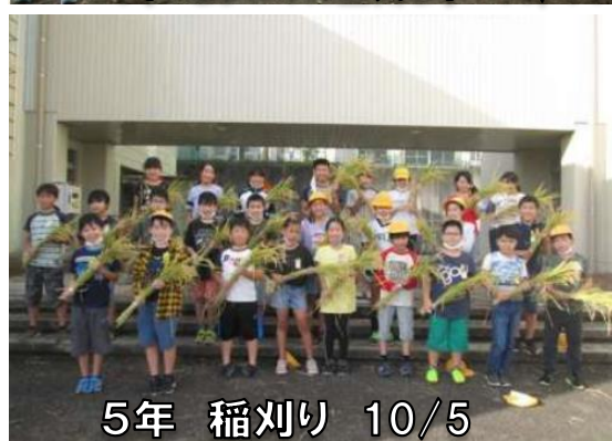
5年 稲刈り 10/5