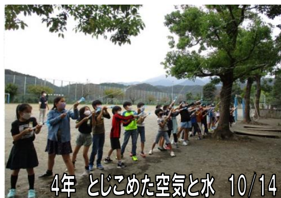
4年 とじこめた空気と水 10/14