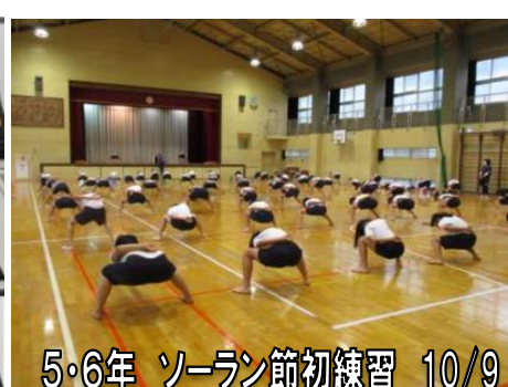
5・6年 ソーラン節初練習 10/9