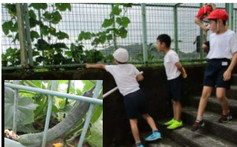
2年 夏野菜の栽培と観察 6/25