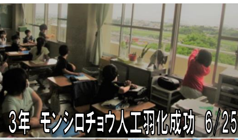
3年 モンシロチョウ人工羽化成功 6/25