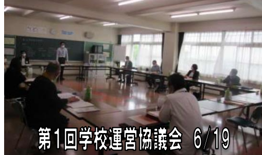
第1回学校運営協議会 6/19

第1回学校運営協議会では、今年度の学校教育方針や今後の行事等の変更について共通理解しました。 今年度は、新型コロナウイルス感染症予防のため、学校・家庭・地域では、様々な変更を余儀なくされています。しかし、「児童の健やかな成長」のために、私たちができることを考える有意義な会となりました。