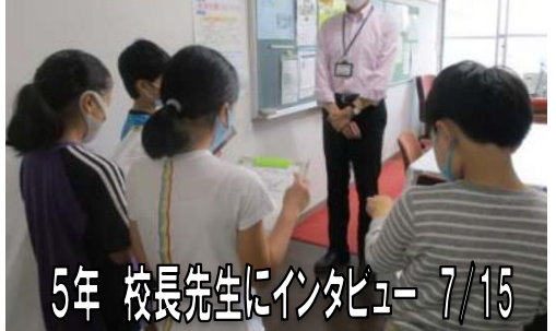
5年 校長先生にインタビュー 7/15