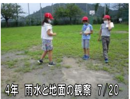
4年 雨水と地面の観察 7/20