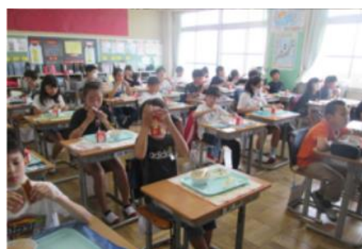
6年 完全給食再開 7/1

第1回学校運営協議会では、今年度の学校教育方針や今後の行事等の変更について共通理解しました。 今年度は、新型コロナウイルス感染症予防のため、学校・家庭・地域では、様々な変更を余儀なくされています。しかし、「児童の健やかな成長」のために、私たちができることを考える有意義な会となりました。