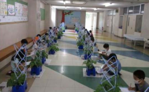
1年 あさがおの栽培と観察 7/1