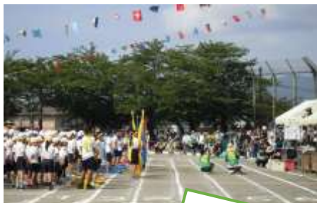
今の校庭での最後の運動会。来年は、新しい校庭での実施になります。

今月下旬から始まる校庭改修工事の関係で、今年度の運動会は1学期に開催されました。まだ慣れない環境の中、一人一人が自分にできることを自分のペースで一生懸命に頑張っていました。いろいろな場面でそれぞれの成長した姿が見られたうれしいひと時でした。