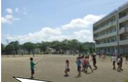
保健室から見える空は、すっかり「夏空」。 暑さのためか、外遊びの子どもたちも少な目です。

今年は例年よりも梅雨明けが早く、とても暑い日が続いています。この暑さの中、子どもたちは各教室にあるエアコンのおかげで室内では比較的涼しい環境で過ごせています。また、ご家庭の皆様の体調管理や水筒の準備等のご協力のおかげで、子どもたちの体調も大きく崩れることなく過ごせ、日々感謝しています。