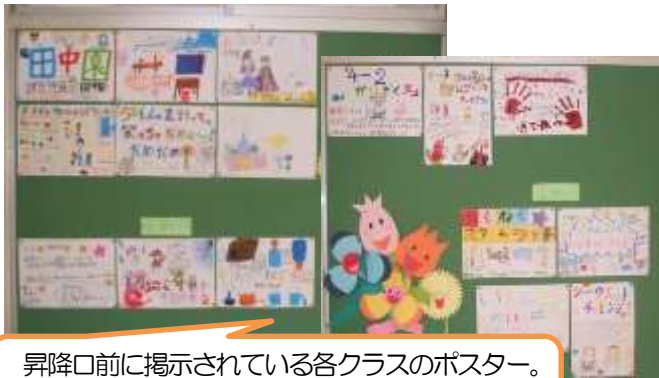
昇降口前に掲示されている各クラスのポスター。どれも工夫されていて、当日が楽しみです。

毛まつりが近づいてきました。季節的には暑くなったり、雨が降ってじめじめしたりと過ごしにくい時期ですが、毛まつりという大きな目標があるおかげか、子どもたちはいろいろな作業に頑張っておりながら、元気に過ごしています。