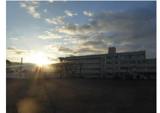
戸室小から望む初日

子どもたちの「元気と笑顔」のために教職員、保護者や地域、関係機関の皆様でさらなる連携を大切にしながらよりよい教育の創造に漕ぎ出していきたいと思います。