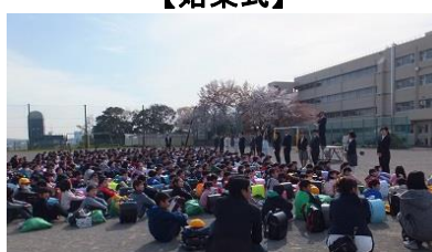
一番ドキドキする担任の先生の発表