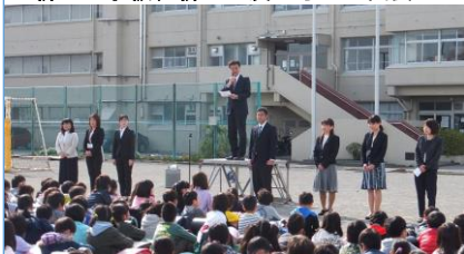
新しい先生をお迎えしました