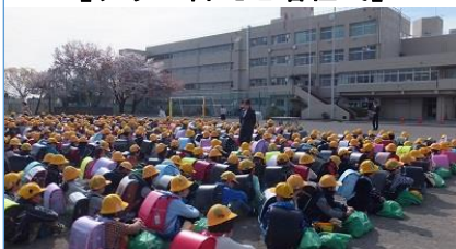
新しい学級、新しい友だちとの出会い