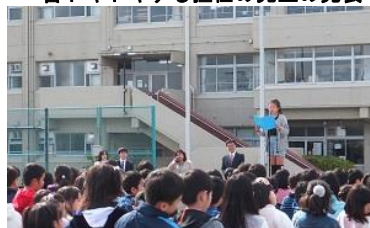
最高学年の抱負を述べました