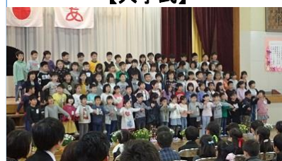
2年生によるお迎えの出し物