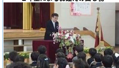
集中して話を聞く1年生です