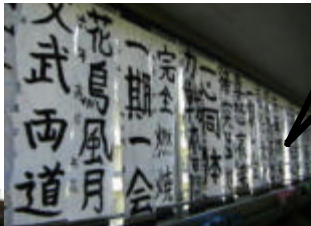
6年生の作品と制作風景

毎年恒例の書き初め大会が行われました。1・2年生は、油性ペンで、3年生からは太筆で書きました。