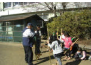
<竹馬で遊ぶ子どもたち>

3学期もあと2ヶ月となりましたが、皆様のご支援をいただきながら、学校経営に努めて参ります。