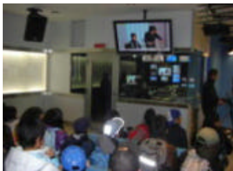
<アナウンサーの疑似体験>

アナウンサー体験をしたり、スタジオ見学をしたりして、放送のしくみなど学習を深めることができました。