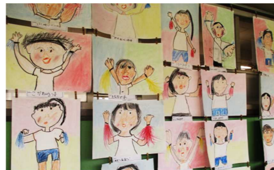
1年生「うんどうかい」