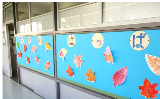
学習室「あきのはっぱ」

そういえば、保育士の長女は「お箸がちゃんと持てないの。どうしたらいいのかなあ・・・」と嘆いていました。いやいや、小鮎小の子どもたちも、お箸の持ち方、使い方があやしい子がたくさんいるようです・・・