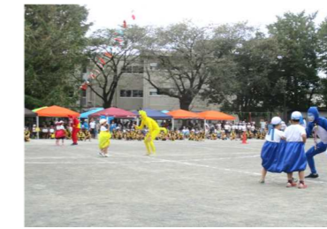
< 2年生団体競技 >