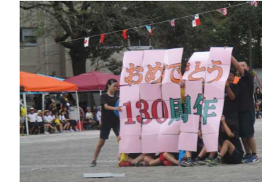
< 5年生表現 >