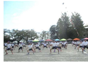
< 4年生ダンス >