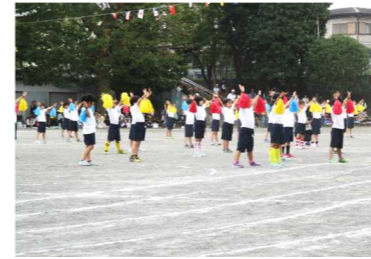
< 1年生ダンス >