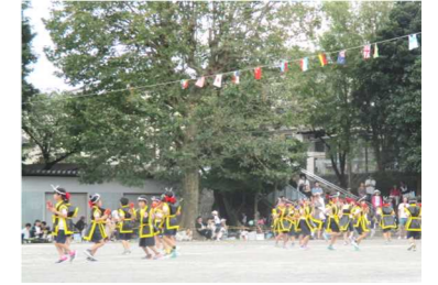
< 3年生ダンス >