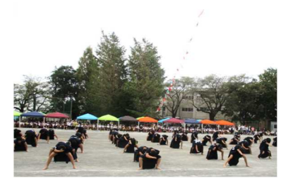
< 6年生表現 >

< 11/5 (火) ~ 11/8 (金) は 『学校へ行こう週間』 です! >