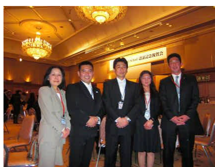
附属池田小 ISS 認証式