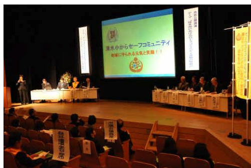
セーフコミュニティ認証取得に向けての総決起大会