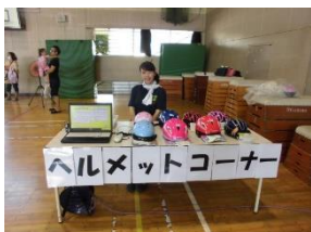
[一昨年度のヘルメット抽選会]

今年度もPTAふれあいまつりにヘルメットコーナーを開設します。子ども用自転車ヘルメットの販売をするほか、一昨年度に大好評だったリサイクル自転車ヘルメットの抽選会を計画しています。