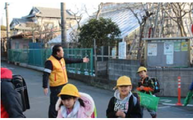
〈PTAと地域の方々によるあいさつ運動〉

教職員・登校班役員が各学期の始まり3日間、各地域に分かれて登校指導を行っています。特に狭い道の歩き方や横断歩道の渡り方など、指導しています。