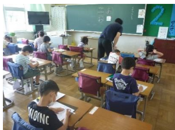
1年生でもこの集中力!

子どもたちは5回ずつ登校しました。全員が集まらない寂しさはありますが、A、Bどちらのグループも落ち着いて学習や活動に取り組んでいます。職員は、久しぶりに子どもたちと授業ができるので、嬉しくてつい力が入ってしまうのですが、子どもたちもはりきっています。学習への集中力がすごいです!一生懸命話を聞いて、考えて、書いて、体も動かして…充実した時間を過ごしています。頑張りすぎて体調を崩さないよう気を付けましょう。