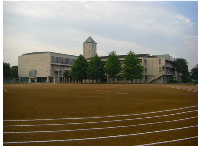
厚木市立睦合東中学校