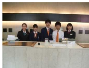
厚木アーバンホテル