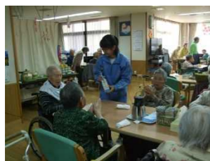
七沢グリーンホーム

○自分で必要だと思ったことを自主的にやるのがたいへんだ。やるべきことがたくさんあって、昼寝の時間も忙しく、休んでいる暇が全くなくて、仕事ってたいへんだなと思った。思っていたより大変で忙しかったけれど、自分のためだけでなく、子ども達のために働くのだと実感した。今後、「他人のためにできること」を見つけていきたい。その場に応じての知識はもちろん大事だけれど、礼儀や自主性はもっと大事だと思う。【保育園コスモス】