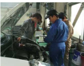
セイロモータース