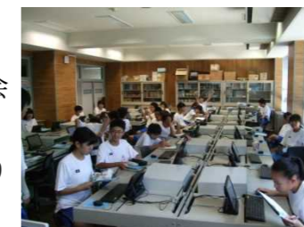
数学の授業の様子