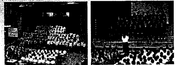
(画像は昨年度2016のもの)

当日は、合唱だけでなく、吹奏楽部や混声合唱団、各教科による展示など生徒の日頃の学習の成果をぜひご覧いただきたいと思っております。