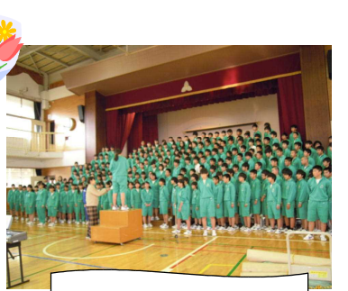
体育館での学年練習風景

2年間お世話になった3年生が3月9日に卒業します。長い間みなさんのお手本となり荻野中を支えてきてくれた3年生。荻野中での最後の日々を素晴らしい思い出としてもらえるよう、一つ一つの準備や練習に心を込める——それが私達にできることです。