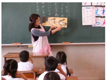
おはなしポケット