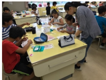
裁縫ボランティア