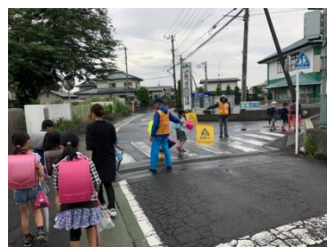
見守りボランティア