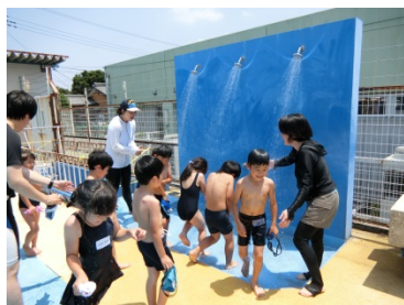
水泳ボランティア