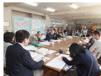
学校関係者評価会議

2月22日には「第3回学校運営協議会」を南毛利小学校で行いました。これからの学校は「地域との連携・協働」抜きに教育の質を高めていくことは考えられません。南毛利中学校区統合コミュニティ・スクールのスタートを機に「学校」「家庭」「地域」が育てたい子ども像を共有する「地域と共に歩む学校」を目指していきましょう。