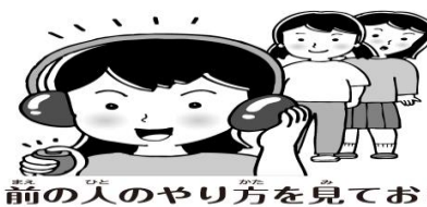
前の人のやり方を見ておく