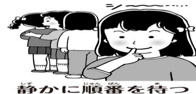
静かに順番を待つ