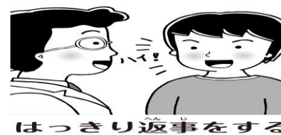
はっきり返事をする