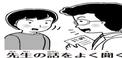
先生の話をよく聞く