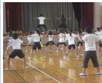
今年度の応援回は、新しい試みとして演舞を特訓中です！

もうすぐ運動会！！ 10/28（土）の運動会に向けて、子どもたちは一生懸命練習に励んでいます。一方で、活動場所が広がり教室移動が多かったり、持ち物もいろいろと増えたりすることから、落とし物や紛失物が増加しやすい時期でもあります。先日、体育着に着替えた後の短パンがなくなってしまう事案があり、今も探しています。ご家庭でもお子様が持ち帰った物の中に他の児童の物が紛れ込んでいないか、注意してご覧いただけますとありがたいです。学校でも一層注意して見ていくとともに、教室環境の整備に努め、物を大切にすることや持ち物の管理について継続して指導してまいります。ご家庭でもお子様の持ち物についてお気づきのことがありましたら、学校にお知らせください。皆様のご協力をよろしくお願いいたします。